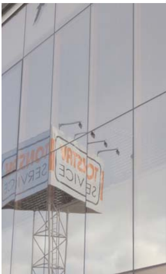
TONSTAV- SERVICE s.r.o.